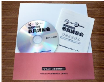
デジタルコースの主な教材一式