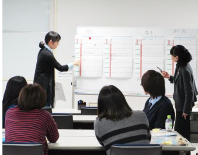
スクーリングの模擬授業の様子

50 時間の講習で「介護に関する体系的な知識」と「それらを伝える指導法」を学ぶことができ、介護福祉リーダーとしてのキャリアアップに役立ちます。