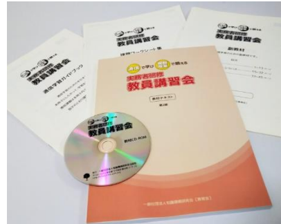
郵送コースの主な教材一式