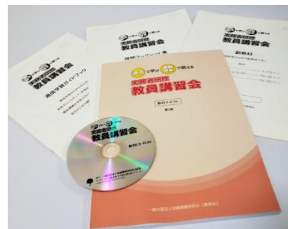
郵送コースの主な教材一式