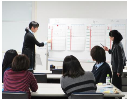
スクーリングの模擬授業の様子

50時間の講習で「介護に関する体系的な知識」と「それらを伝える指導法」を学ぶことができ、介護福祉リーダーとしてのキャリアアップに役立ちます。