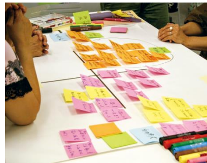
スクーリングのグループワークの様子