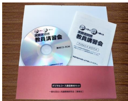
デジタルコースの主な教材一式