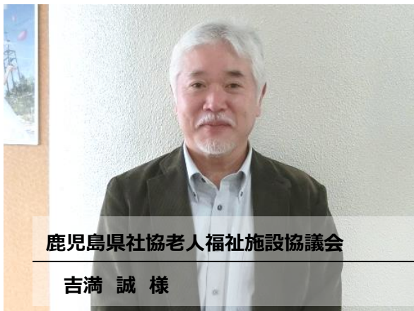
鹿児島県社協老人福祉施設協議会

J H A 日本ハンドリフレクソロジー協会 / ハンドリフレクソロジー専門学院 運営：株式会社 Z A C 研修・コンサルティング研修実績