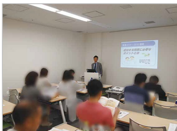
これまでにメディックスが開催した開業セミナーの風景