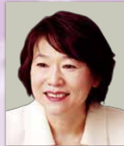
ASK梓診療報酬研究所 所長