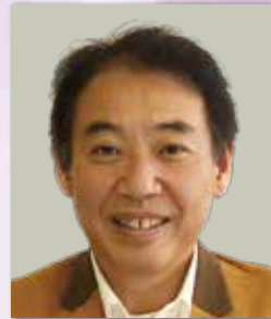
医療法人社団永生会 理事長補佐・在宅統括部長