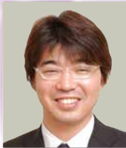
株式会社メディヴァ 取締役 コンサルティング事業部長