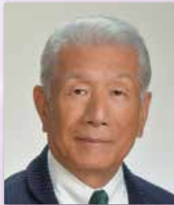
一般社団法人日本慢性期医療協会 会長 医療法人 平成博愛会 博愛記念病院 理事長