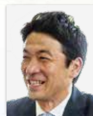
社会福祉法人征峯会 理事長