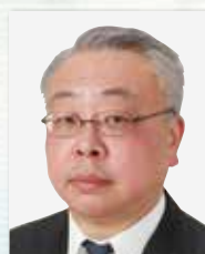
ウェルフェア・ユニテッド株式会社 代表取締役社長