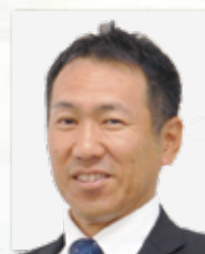
社会福祉法人四ツ葉会 理事