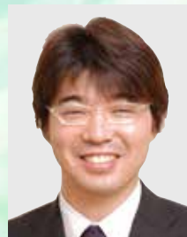
株式会社メディヴァ 取締役 コンサルティング事業部長

参加料 【税込】 本体価格 HMS会員(法人・個人会員) 25,740円 (23,400円) (購読会員) 27,170円 (24,700円) 一般 28,600円 (26,000円)