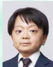
株式会社メディヴァ コンサルティング事業部 グループリーダー